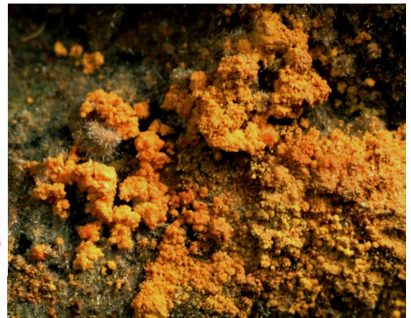
La marécottite, une nouvelle espèce minérale des Marécottes, VS