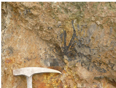
Ilvaïtes dans skarn, Rio Marina